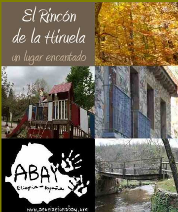
Encuentro en Madrid

Planteamos para el futuro la edición de los relatos publicados.