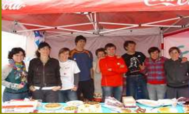
Estuvimos en la carrera-trail Donosti-Hondarribia