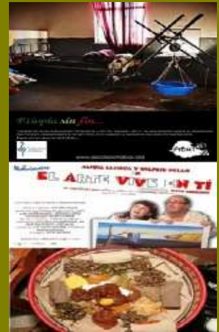
Mes de Etiopía en el Colegio de Médicos de Valencia