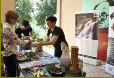
Fiesta de la primavera en la nostra escola comarcal

En el Colegio Pablo Picasso de Valladolid se celebró el ya tradicional Desayuno solidario por Etiopía.