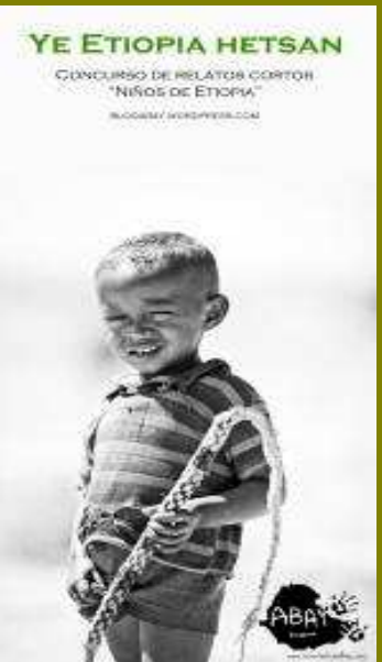
El concurso de relato corto "Niños de Etiopía-Ye Etiopia Hetsan" tuvo una gran participación.

Planteamos para el futuro la edición de los relatos publicados.