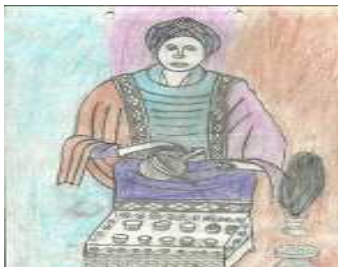
Recibimos nuevos dibujos que nos ayudan a conocer Etiopía.